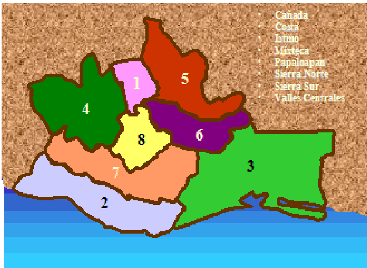
Mapa de las ocho regiones geoeconómicas de Oaxaca.

Para una mayor ubicación geográfica se anexa el mapa con la división política de las ocho regiones en que se divide el estado de Oaxaca por su extensión territorial: Cañada, Costa, Istmo, Mixteca, Tuxtepec o Papaloapan Sierra Sur, Sierra Norte y Valles Centrales. 45