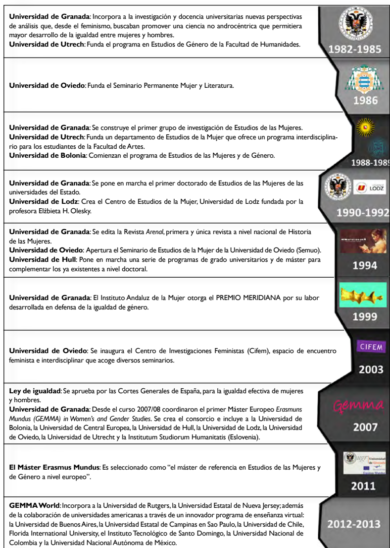
Figura 2.1. Línea del tiempo de antecedentes y constitución del Máster Gemma